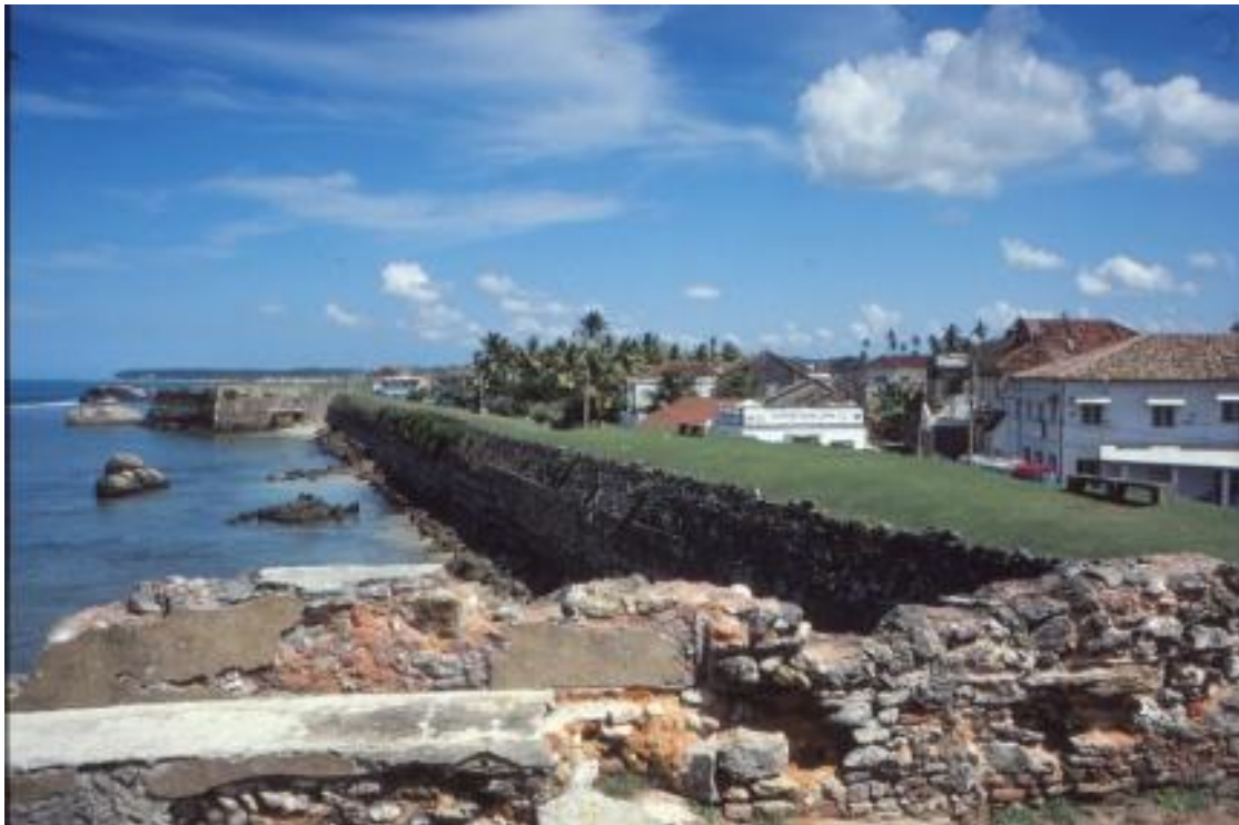
Fortet i Galle.