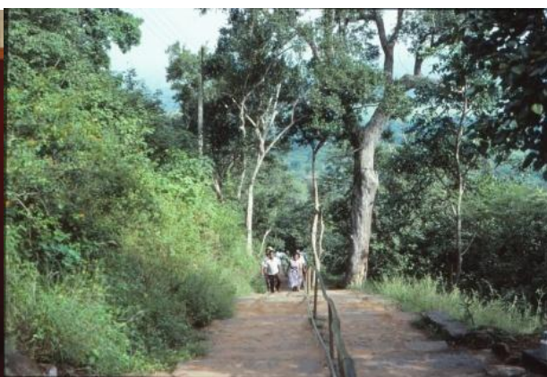
Två tusen trappsteg.

Under dagen hade man planerat att besöka Wadahiti Kanda, ett litet tempel uppe på en bergstopp. På mitt förslag beslöt man att starta under morgontimmarna för att slippa den värsta hettan fram på dagen. Efter två tusen trappsteg genom ogenomtränglig djungel fick vi så småningom lön för all möda och svett. En vidsträckt utsikt bredde ut sig under våra fötter och utan svårighet kunde man hitta templet vi besökt kvällen innan. Det lilla templet som balanserade på toppen bestod av de obligatoriska delarna, en tempellokal, dagoban samt det heliga bodhi-trädet. Enligt legenden fick Sidharta Gautama sin upplysning under ett fikus-träd, Ficus religiosa , och blev därmed den första buddan.