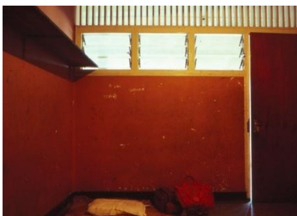
Mitt rum på Pilgrims Rest.

Med fog kan man säga att möblemanget i rummen var mycket spartanskt, i mitt rum bestod det av en naken glödlampa i taket samt en väggfast hylla av trä utefter den ena långsidan.