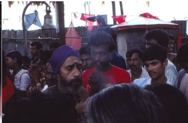
Munken som utförde ceremonierna.

Två järnräcken bildar en gång fram till altaret och den lilla buddastatyn. Besökarna samlas på utsidan av järnräckena och i den fria gången emellan började en annan munk utföra en del ceremonier. Mina kamrater föste fram mig till en ledig plats vid räcket och det fanns inget annat att göra än att som ende europé delta i ritualerna. Först gick munken runt längs räcket med rökelse, därefter delade han ut en handfull kokt ris. När det blev min tur hajade han till vid min vita handflata, våra ögon möttes ett kort men magiskt ögonblick, ett leende och jag fick min risportion. Efter rundan med risskålen var det dags att ge de närvarande en kritprick i pannan, så även jag.