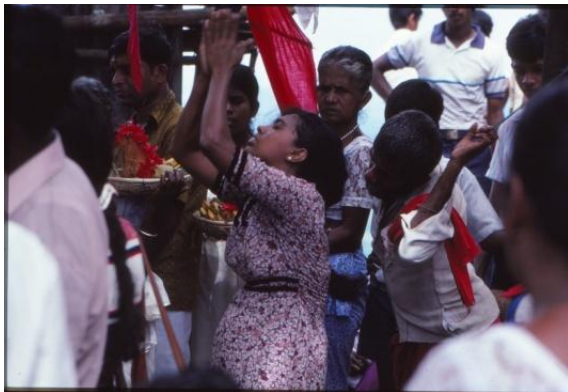
I trance, munken till höger.

Munken börjar ringa i ett batteri små kyrkklockor och snart samlas folk i den enkla tempellokalen som egentligen endast består av ett solskydd. Nu inträffar det sällsamma att munken förefaller att falla i trance. Helt slutet i sig själv håller han ett högt tempo på klockorna och nu förstärks det sällsamma när en kvinna börjar röra sig rytmiskt efter klockorna. De verkar vara helt omedvetna av omgivningen, fullt upptagna med att följa klockornas rytm. Förtrollningen bryts först när munken låter klockorna sakta in för att till sist tystna, kvinnan och munken är snart som vanligt igen.