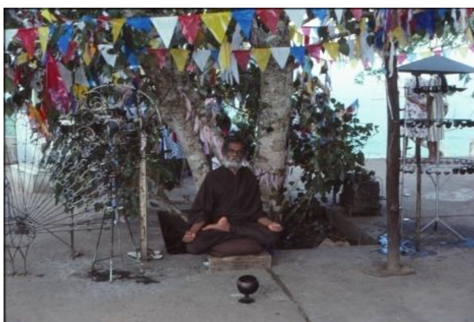
Att söka insikt genom meditation.

Under dagen hade man planerat att besöka Wadahiti Kanda, ett litet tempel uppe på en bergstopp. På mitt förslag beslöt man att starta under morgontimmarna för att slippa den värsta hettan fram på dagen. Efter två tusen trappsteg genom ogenomtränglig djungel fick vi så småningom lön för all möda och svett. En vidsträckt utsikt bredde ut sig under våra fötter och utan svårighet kunde man hitta templet vi besökt kvällen innan. Det lilla templet som balanserade på toppen bestod av de obligatoriska delarna, en tempellokal, dagoban samt det heliga bodhi-trädet. Enligt legenden fick Sidharta Gautama sin upplysning under ett fikus-träd, Ficus religiosa , och blev därmed den första buddan.