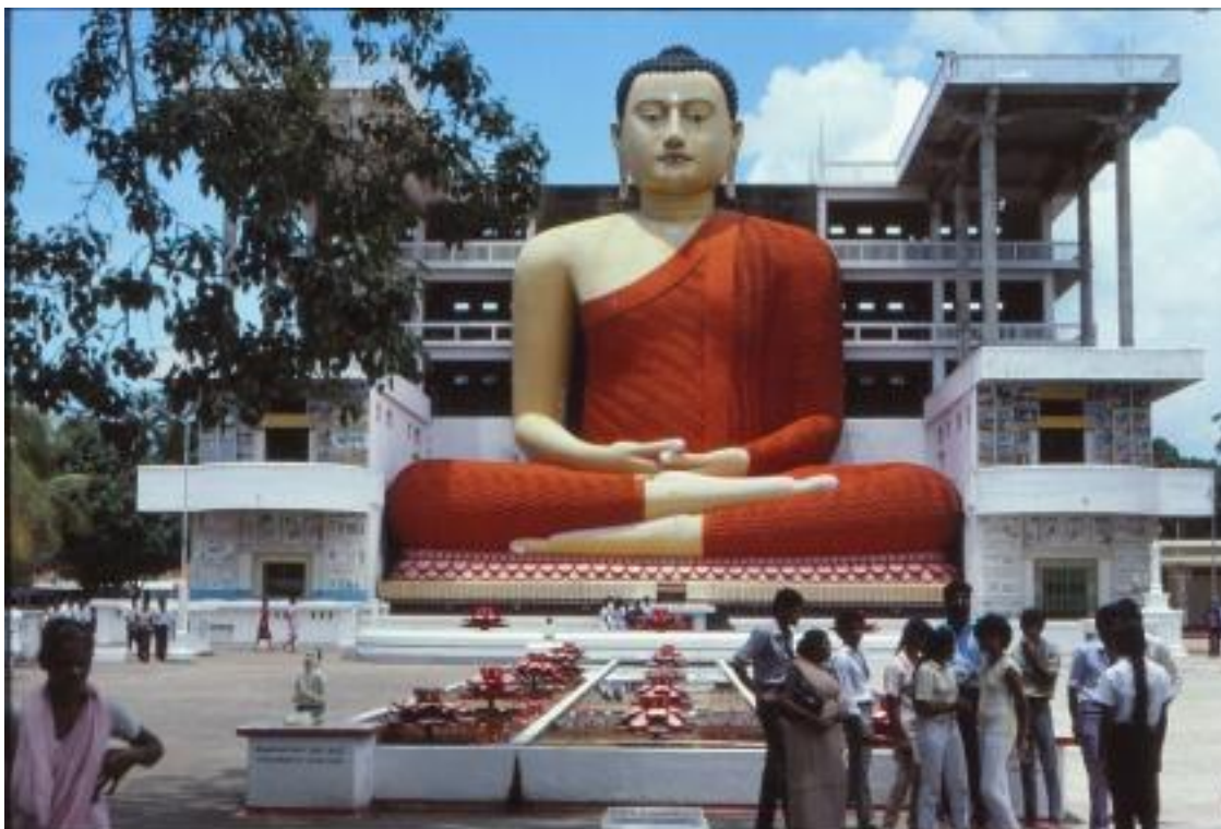
Buddisttemplet i Matara.

Några välbehövliga bensträckare utmed vägen hade blivit välkomna avbrott under resans gång, ett av dem var vid det stora buddisttemplet i Matara. Väggarna i templet var fyllda med bilder ur Mahavamsa, en buddistisk krönika. Som ur en jättelik bilderbok kunde man följa alla viktiga händelser från det Siddharta Gautama blev en upplyst för mer än tvåtusen år sedan och vidare framåt i historien.