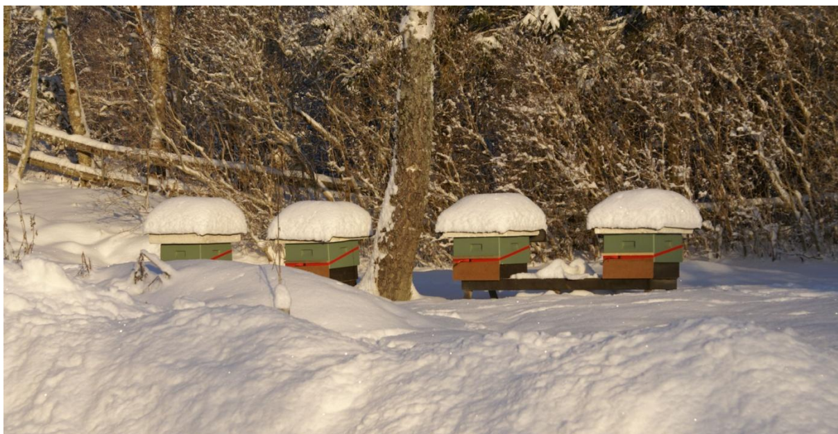
Ännu en snörik vinter 2010 – 2011