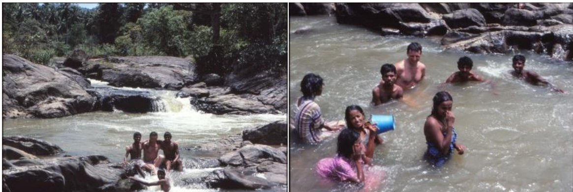
Ett svalkande bad i en bäck.

Efter ytterligare någon dags rundtur i Kataragama vände vi hemåt igen med flera minnesvärda stopp längs vägen. Denna gång följde vi inte kusten utan vek av inåt landet. Ett av stoppen gjordes intill en större bäck med lugnt bakvatten mellan forsarna. I stort sett hela gänget hoppade i för ett svalkande dopp, vissa med kläder och allt.